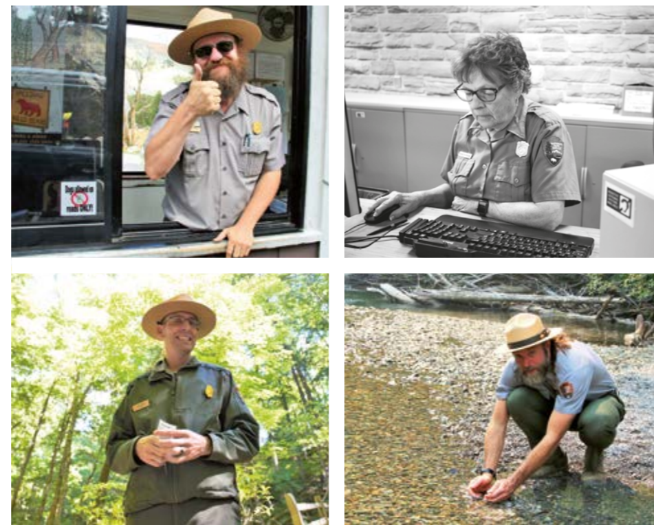
Park Rangers – Najvidljivija lica američkog parkovnog sustava