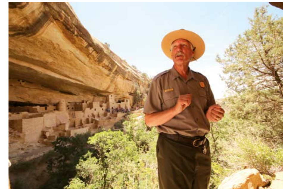
Mesa Verde, Colorado

Acadia · American Samoa · Arches · Badlands · Big Bend · Biscayne · Black Canyon of the Gunnison · Bryce Canyon · Canyonlands · Capitol Reef · Carlsbad Caverns · Channel Islands · Congaree · Crater Lake · Cuyahoga Valley · Death Valley · Denali · Dry Tortugas · Everglades · Gates of the Arctic · Glacier · Glacier Bay · Grand Canyon · Grand Teton · Great Basin · Great Sand Dunes · Great Smoky Mountains · Guadalupe Mountains · Haleakala · Hawaii Volcanoes · Hot Springs · Isle Royale · Joshua Tree · Katmai · Kenai Fjords · Kings Canyon · Kobuk Valley · Lake Clark · Lassen Volcanic · Mammoth Cave · Mesa Verde · Mount Rainier · North Cascades · Olympic · Petrified Forest · Pinnacles · Redwood · Rocky Mountain · Saguaro · Sequoia · Shenandoah · Theodore Roosevelt · Virgin Islands · Voyageurs · Wind Cave · Wrangell-St. Elias · Yellowstone · Yosemite · Zion