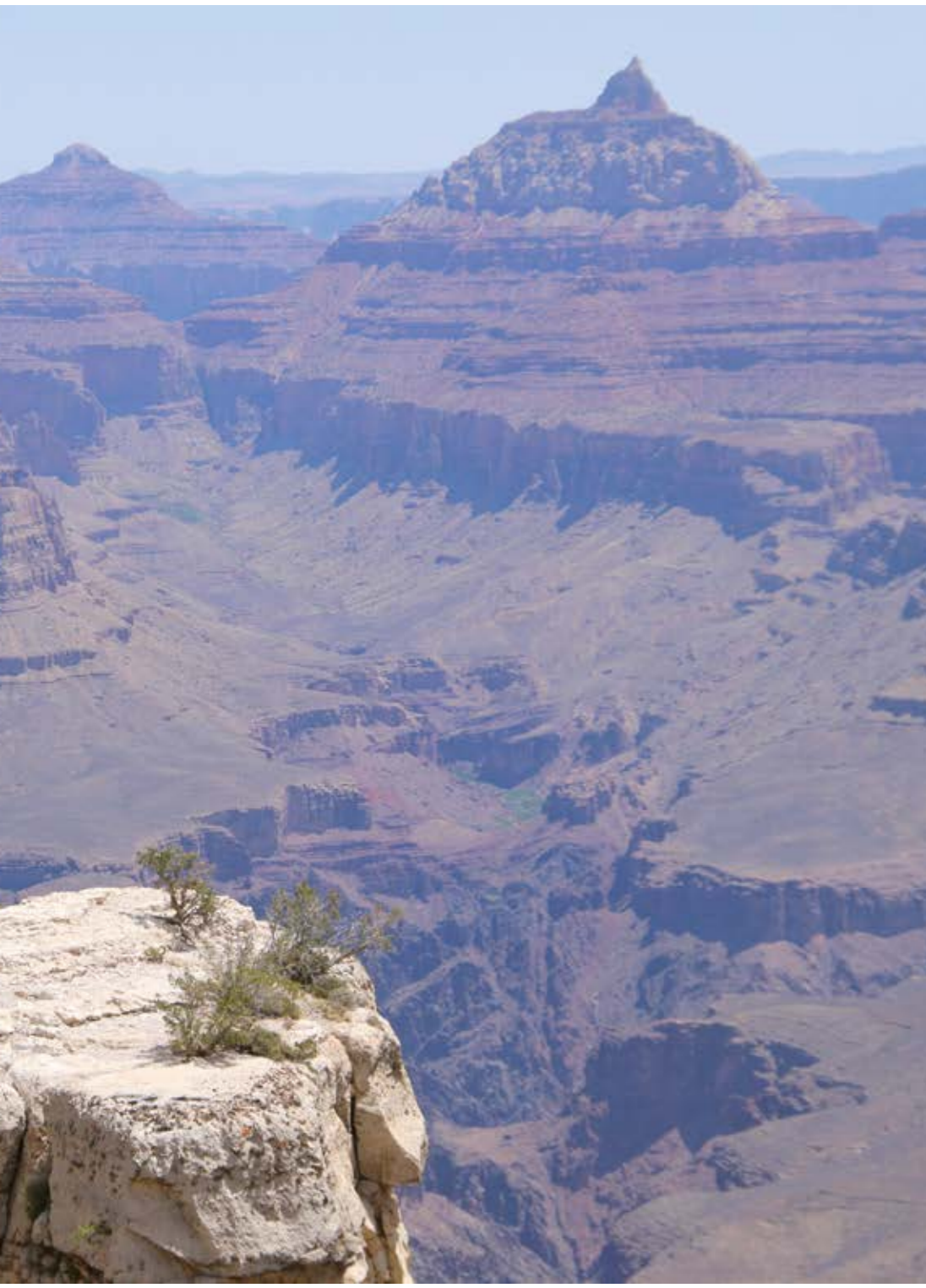
Grand Canyon, Arizona